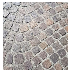
Place du Molard