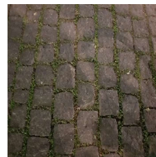
Place de la Petite-Fusterie

Nous recommandons qu'aucune zone pavée ne soit nouvellement créée. Si cela devait être le cas, la pose d'une bande carrossable telle que décrite plus haut est impérative.