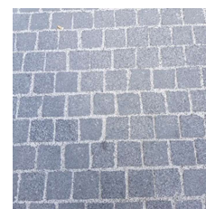
Quai des Bergues